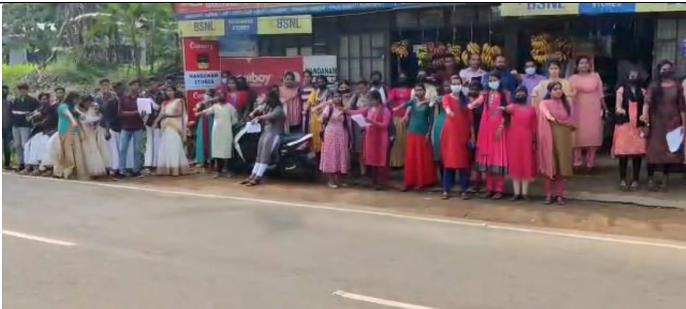
Pledge Against Drug Abuse